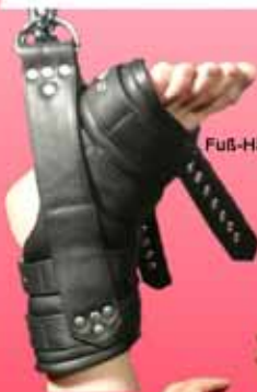
Schwere Fuß-Hängfessel 109,00 €