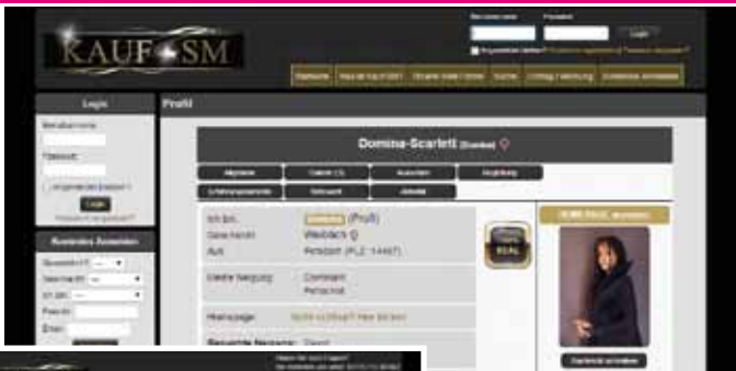
Eindruck vom Einzelprofil

Damen, die jeweils mit einem eigenen Eintrag vorhanden sind, verbinden. Im Profil des Studios werden dann die Damen, die dort arbeiten aufgelistet.