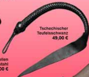
Tschechischer Teufelsschwanz 49,00 €