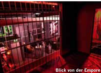
Blick von der Empore

ausgerichtet, sei denn, die Gäste sind bereit beim Spiel platzmäßig Abstriche hinzunehmen.