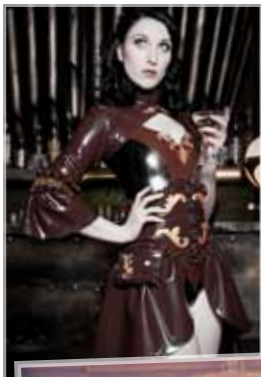
Model: Apple Doll