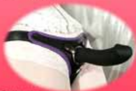
StrapOn-Harness, verschiedene Farbvarianten, Größen S / M / L 59,00 € (Ohne Plug)