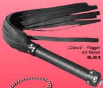
„Clavus“-Flogger mit Nieten 46,00 €