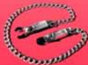
McHurt-Klavieren zum Schrauben, mit Kette 18,40 €

... und noch mehr gemeinsames Spielzeug!