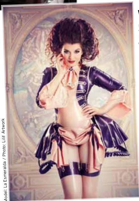
Model: La Esmeralda

Man muss keine internationale Fetischgröße sein, um Isabeau Ouvert Latex Fashion zu tragen, aber man ist dabei