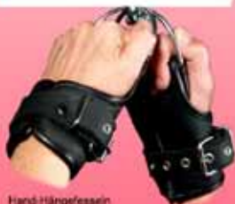
Hand-Hängefessel aus weichem Rindleder, gepolstert 54,50 €