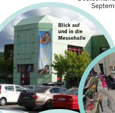
Blick auf und in die Messehalle

Zum ersten Mal fand das BoFeWo-Wochenende im Messezentrum in Hofheim bei Frankfurt statt. Fast 50 Aussteller aus ganz Deutschland und hunderte Gäste hatten sich Ende September eingefunden. myKiNK war vor Ort.