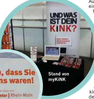
Stand von myKiNK

Auch wir finden, dass es bislang an einer Messe inmitten Deutschlands fehlte. Diese Lücke scheint nun geschlossen. Der dezentrale Ort ist kein Nachteil, da Hofheim nahe wichtiger Autobahnen liegt und die großen, hauseigenen Parkflächen optimal sind. Das Messezentrum liegt in einem Industriegebiet und bildet damit ein geschütztes Refugium für die kinky Szene. Die Infrastruktur der Messehallen ist perfekt und bietet unglaubliches Entwicklungspotential. Da die Veranstalter eine sehr solide Arbeit leisten, gibt es keinen Grund nicht davon auszugehen, dass auch noch die kleinen Kinderkrankheiten geheilt werden. Wir kommen wieder! ■